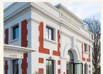
Olonne sur Mer