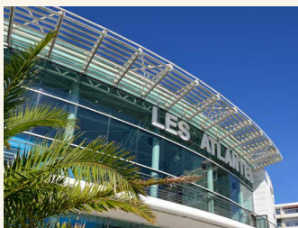
Les Sables d'Olonne

Vous ne souhaitez pas être partenaire ? Vos brochures ne seront pas en libre-service dans nos 4 Bureaux d'Accueil.