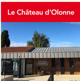
Le Château d'Olonne